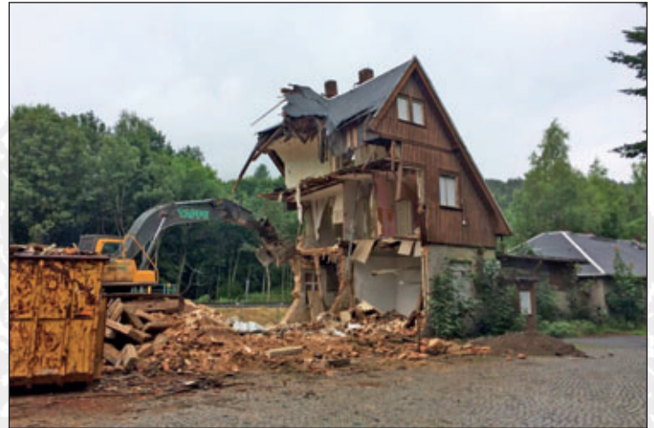
Abriss ehemaliger Bahnhof Meinersdorf

Nach einem langwierigen bürokratischen Verfahren erfolgte durch das Eisenbahn-Bundesamt am 22.01.2018 die Freistellung des Geländes von Bahnbetriebszwecken. Somit konnte der Abriss des Gebäudes geplant und ausgeschrieben werden. Am 28.05.2018 erfolgte durch den Gemeinderat der Gemeinde Burkhardtsdorf die Vergabe zum Abriss des Gebäudes „Ehemaliger Bahnhof Meinersdorf“. Am 02.07.2018 wurde mit den Abrissarbeiten begonnen, welche am 15.08.2018 beendet wurden, so dass die Fläche für die Errichtung des Park- und Ride-Platzes zur Verfügung stand.