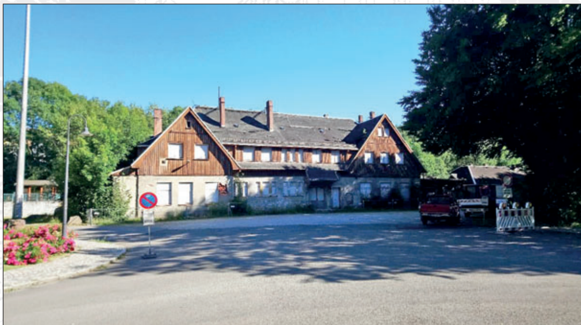
ehemaliger Bahnhof Meinersdorf

Im Vorfeld ersteigerte die Gemeinde Burkhardtsdorf am 22.06.2015, in Absprache mit dem Projektträger Verkehrsverbund Mittelsachsen GmbH, das Gebäude des ehemaligen Bahnhofes Meinersdorf für 5.000,00 €. Hier wurde sich bereits frühzeitig abgestimmt, dass eine ÖPNV-Verknüpfungsstelle (Park- und Ride-Fläche) entstehen soll, welche den Einwohnerinnen und Einwohnern der umliegenden Gemeinden Abstellmöglichkeiten für die Fahrzeuge zur Nutzung der City-Bahn Chemnitz bieten werden.