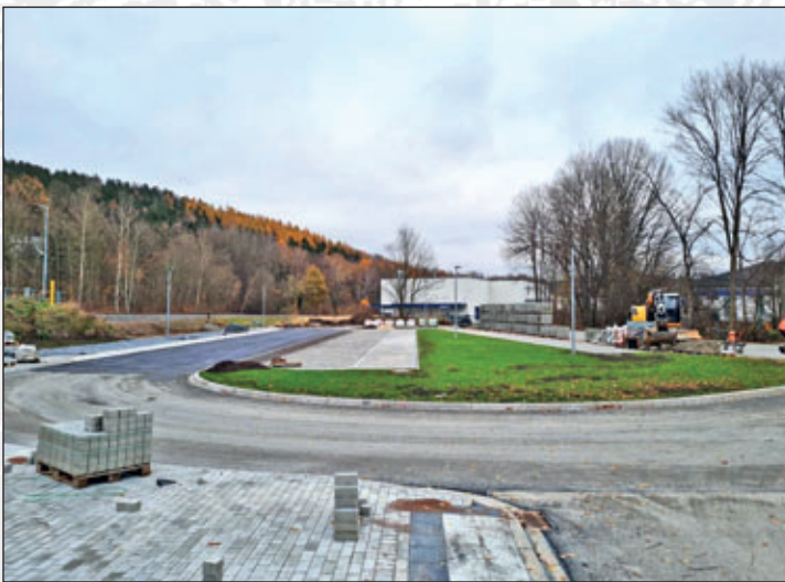
ÖPNV-Verknüpfungsstelle Haltepunkt Meinersdorf

Insgesamt investierte die Gemeinde Burkhardtsdorf 118.890.49 € in das Vorhaben, wovon 90.464,53 € durch das Landesprogramm zur Brachflächenrevitalisierung gefördert wurden.