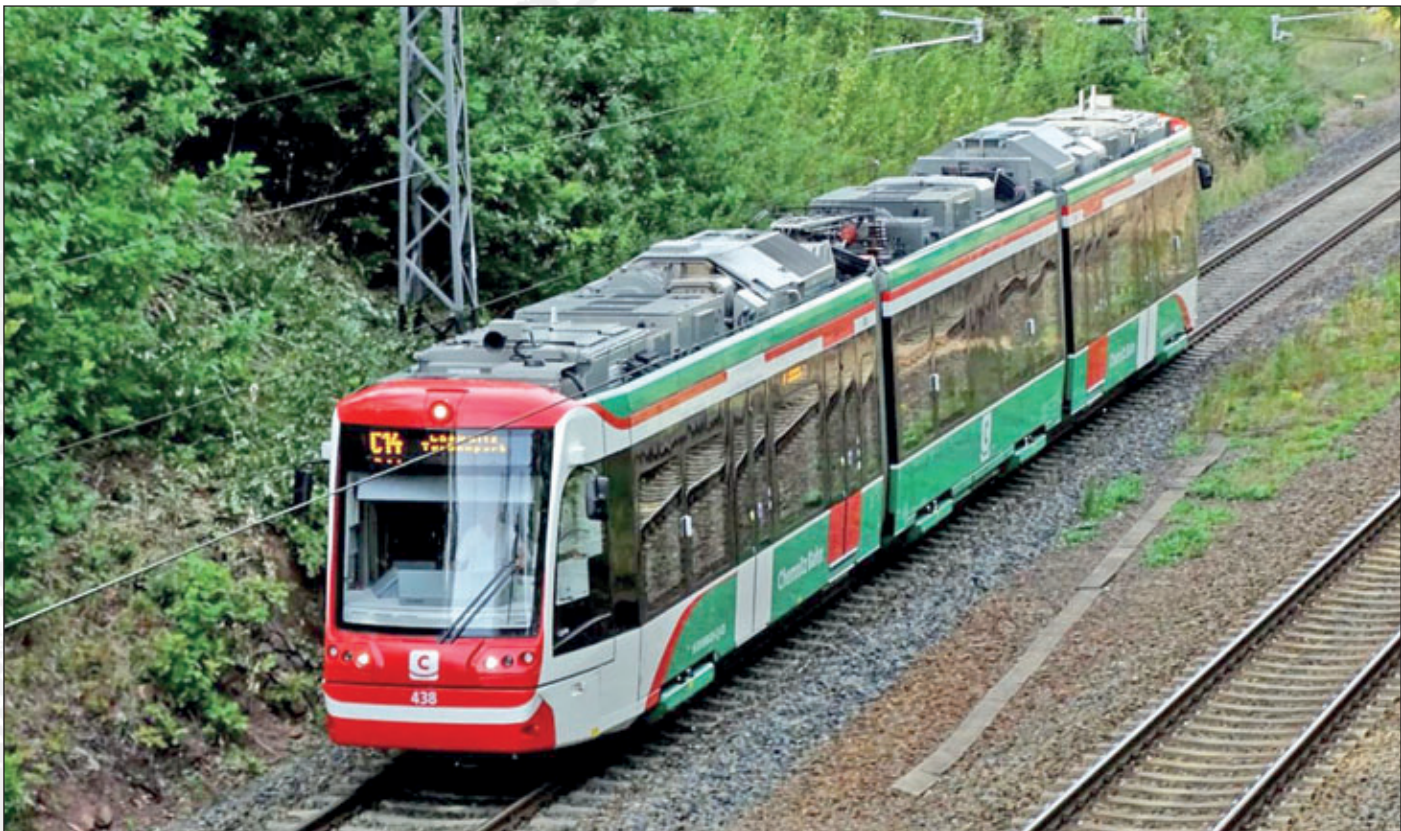
Triebfahrzeug der City-Bahn Chemnitz